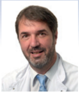
Prof. Dr. med. Dr. h.c. (TSM-Uni.)